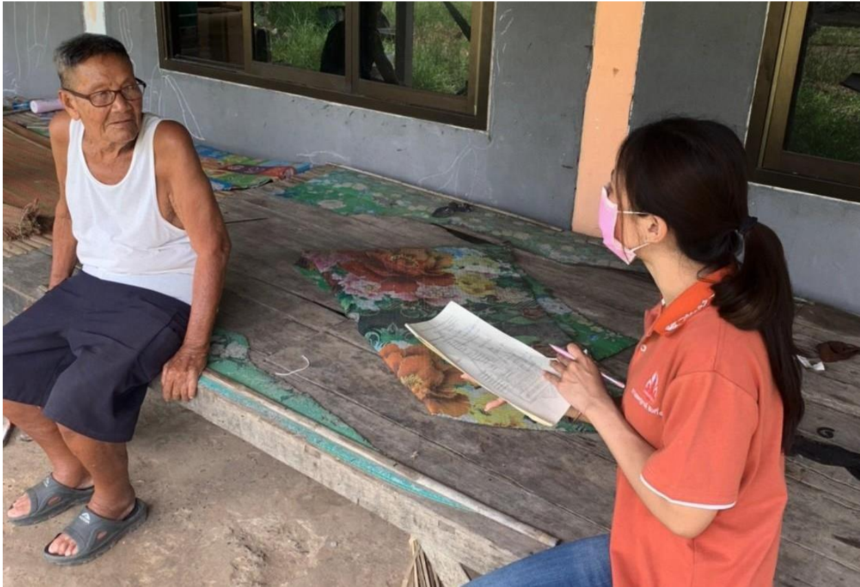
ภาพที่ 5.2 กิจกรรม/โครงการขององค์การบริหารส่วนตำบลโคกกลาง อำเภอโนนสะอาด (2)