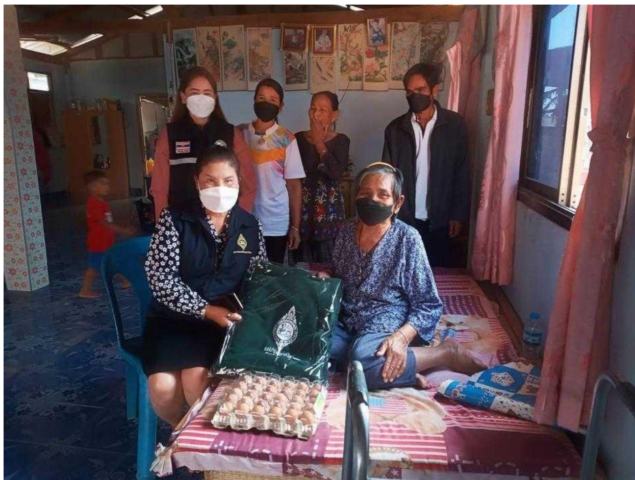
ภาพที่ 5.5 กิจกรรม/โครงการขององค์การบริหารส่วนตำบลโคกกลาง อำเภอโนนสะอาด (4)

2) ควรศึกษาเปรียบเทียบ “ความพึงพอใจของผู้รับบริการขององค์การบริหารส่วนตำบล” หรือ “ความพึงพอใจของผู้รับบริการของเทศบาล” แต่ละแห่งในจังหวัดเดียวกัน หรือ เปรียบเทียบระหว่างภาค ตะวันออกเฉียงเหนือกับภาคอื่นๆ เช่น ภาคใต้ ภาคเหนือ ภาคกลาง เป็นต้น